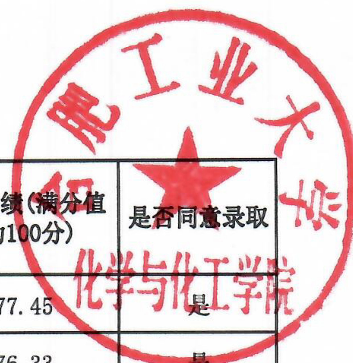
合肥工业大学2024年硕士研究生各专业复试结果汇总表